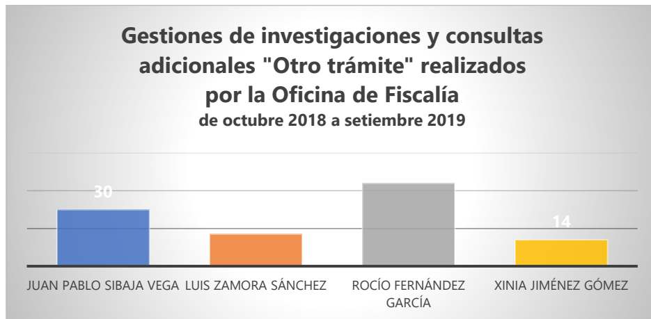
Fuente: Base de datos Oficina de Fiscalía

Para la atención de consultas y denuncias, se generan una serie de actividades adicionales, las cuales son clasificadas bajo el tipo "Otro trámite", los cuales se indican a continuación: